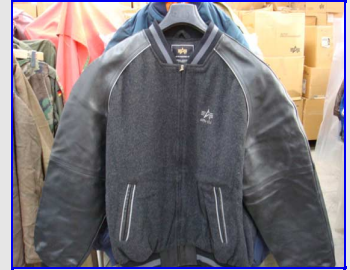
Navy Cruise CPO Vintage Made in USA